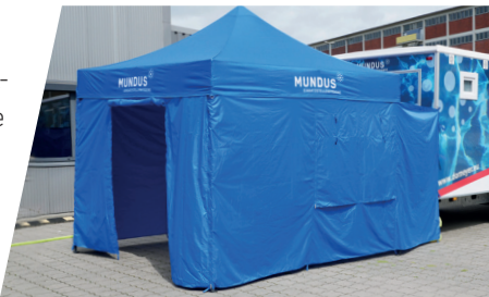
Produktbild zeigt Artikel 241020, 241021 und 241023.

32 Grundfläche 3x3 m, Rahmen aus Rechteckprofil 32 mm, Edelstahl, pulverbeschichtet, alle Teile verschraubt, Dach aus 600D Oxford-Polyester, schwer entflammbar, wasserdicht. Packmaß 1600x250x250 mm, ca. 25 kg. Lieferung einschließlich Heringen, Abspannseilen, Reparaturset, Schutzhülle.